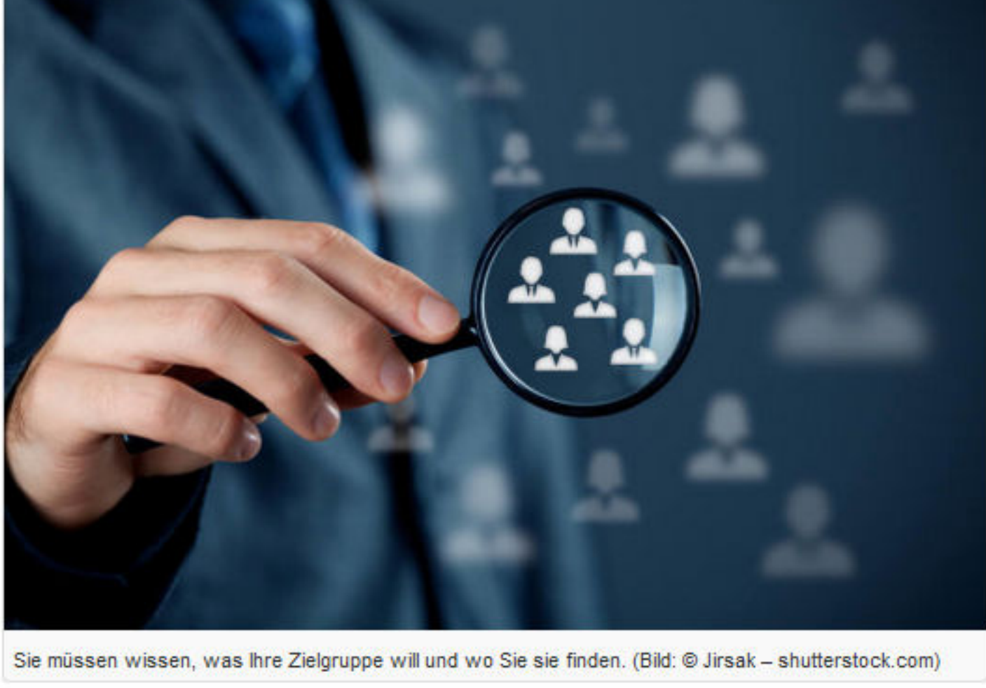
Sie müssen wissen, was Ihre Zielgruppe will und wo Sie sie finden.

Im Grunde genommen ist es mit dem Verkaufen genauso: Sie müssen wissen, was Ihre Zielgruppe will und wo Sie sie finden. Und sicher marschieren Sie auch nicht so mir nichts dir nichts in die Firma hinein, sondern informieren sich vorab so gut es geht über Ihre potenziellen Kunden. Eine gute Bedarfsanalyse ist das A und O!